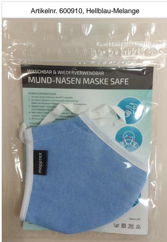
Artikelnr. 600910, Hellblau-Melange