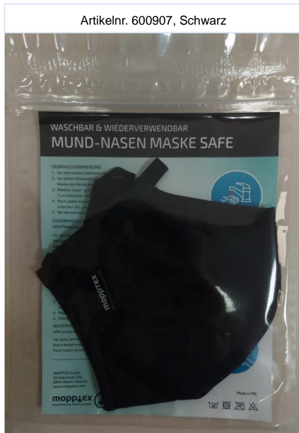
Artikelnr. 600907, Schwarz