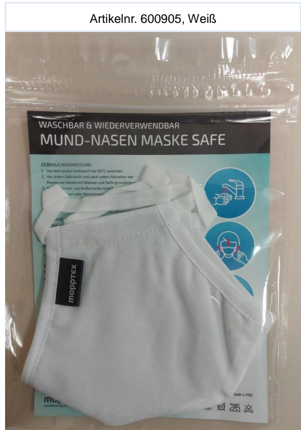
Artikelnr. 600905, Weiß